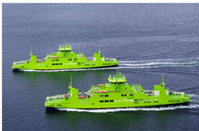
FEERY-BOATS - TRAVESSIA DO SADO

Depois do almoço atravessaremos, em ferry , para a Península de Troia.