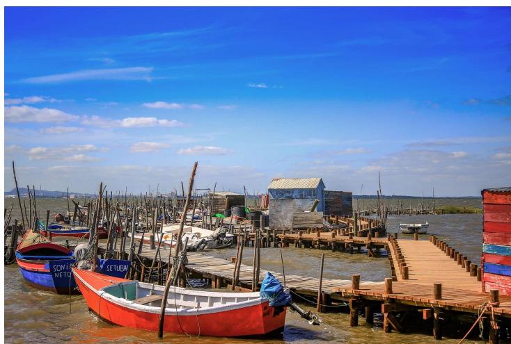
PORTO PALAFÍTICO DA CARRASQUEIRA

Seguiremos depois para o Porto Palafítico da Carrasqueira . Conjunto de estacaria de troncos redondos , que se estende ao longo de um dos esteiros do sapal do rio Sado por onde se circula em ziguezague; as estacas encontram-se meio enterradas no lodo e/ou também na água,