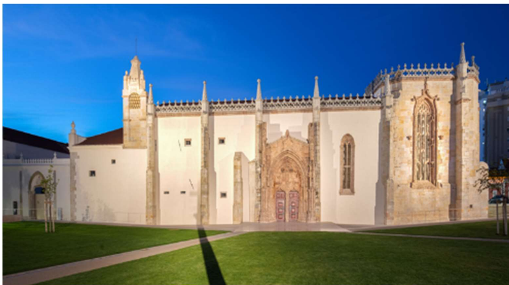
CONVENTO DE JESUS

No Convento de Jesus recorreu-se a soluções inovadoras para época, como os arcos de volta perfeita, abóbadas assentes sobre arcos abatidos e redes de nervuras. Em 1888, com a extinção das ordens religiosas, o edifício é convertido no Hospital da Misericórdia, que ali funcionou até 1959. O Claustro e a Casa do Capítulo do Convento, estão classificados como monumentos nacionais desde 1910 e 1933.