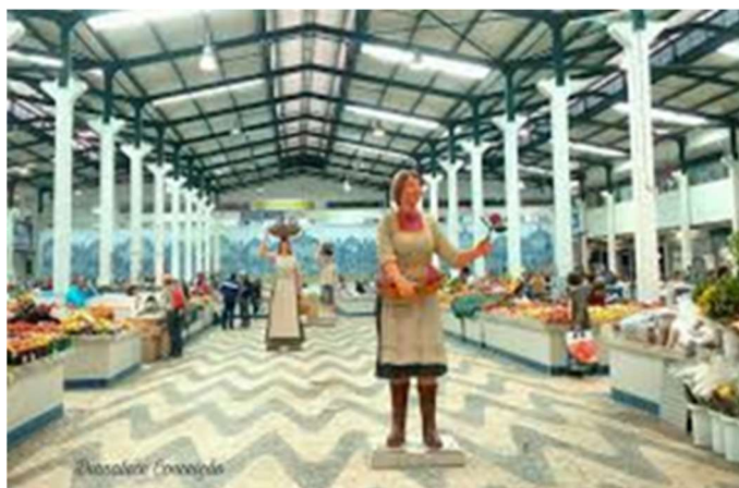
MERCADO DO LIVRAMENTO